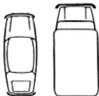
Grafico dell'incidente al momento dell'urto

Indicare i danni visibili al veicolo Leasys